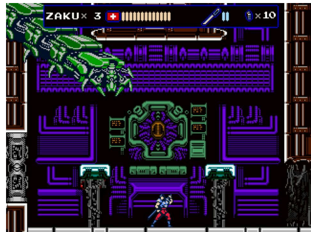
Figura 3: Imagem do jogo Oniken. Dias et al. (2012) [5]

Final, como apontando não apenas por Adrian, mas por Souza et al. [14] e Salazar et al. [12] em seus trabalhos, produzir um GDD completo costuma levar muito tempo e gerar um texto muito grande, difícil de ser lido e de ter os requisitos rastreados.