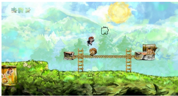
Figura 4: Braid (2008)

dragões em busca de um cálice encantado e, por fim, levá-lo de volta ao castelo dourado de onde toda a história se iniciava. Já no console Super Nintendo (SNES), o jogo The Legend of Zelda: A Link to the Past (1991) baseava-se nos mesmos moldes de Adventure para criar uma das jornadas mais famosas do mundo dos jogos que, ao construir um universo mitológico complexo e incluir aspectos de outros gêneros de jogos – como puzzle e RPG - acabou contribuindo para a ressignificação do estilo aventura na história dos jogos eletrônicos.