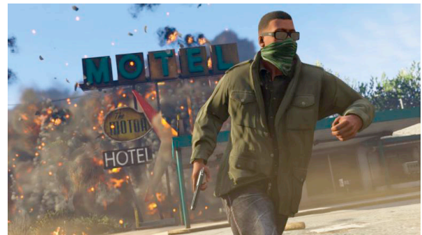
Figura 1: Grand Theft Auto V (2013)

Partindo para o universo dos jogos eletrônicos, observa-se que este tipo de imersão se apresenta de forma mais intensa para os jogadores, principalmente porque os jogos evoluíram muito rápido. Desde o lançamento do Magnavox Odyssey, em abril de 1972, até 2015, as plataformas sofreram grandes transformações tecnológicas, proporcionando melhorias significantes nos gráficos, sons, jogabilidade e até na estruturação das histórias.