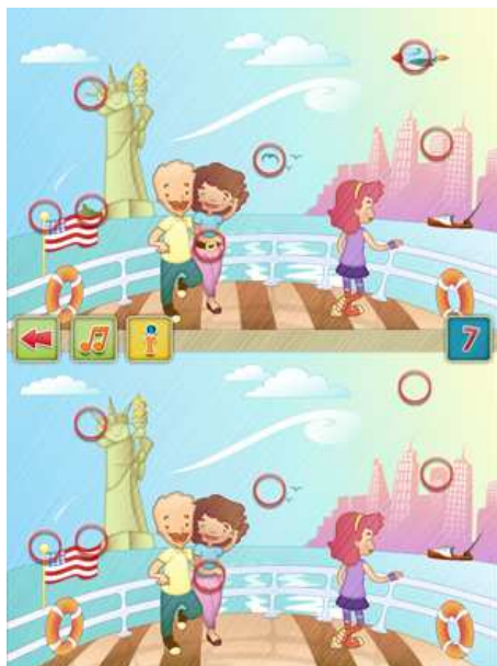
Figura 2: Cenário do jogo – Nova York

O game faz uso da popular mecânica do "jogo dos 7 erros", apresentando na sua narrativa a história de uma família que viaja por alguns lugares do mundo, tirando fotos e registrando os principais pontos visitados. Essas "fotos" são exibidas espelhadas e aparentemente idênticas, porém uma tem 7 diferenças em relação a outra. O objetivo é localizar e apontar essas diferenças presentes entre as duas imagens, que mudam aleatoriamente toda vez que reinicia o cenário.