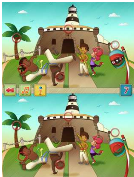
Figura 4: Cenário do Jogo – Bahia-Brasil

Com base nessa linguagem icônica e sonora presente na Viagem dos Pamundo, o jogador tem acesso a aspectos culturais presentes nos diferentes países apresentados no jogo, a exemplo da arquitetura, festas e demais expressões artísticas que caracterizam os diferentes povos.